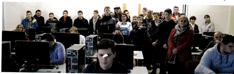
Devetošolci prvič pri srednješolskem pouku.

»Poleg rednega izobraževanja je na obšolah tudi pestro obšolsko dogajanje. Pohvalimo se lahko z veliko dosežki dijakov, ki lahko sodelujejo v številnih projektih - od šport