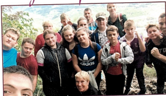
Starejši učenci so se v jesenskih dneh odpravili na Skalo.

Globoko so že zakorakali v šolsko leto. V tem času na šoli nikakor niso počivali. Zavedajo se pomena gibanja in zdrave prehrane, zato so učenci in zaposleni na OŠ V parku zelo aktivni. Redno kolesarijo, se udeležujejo pohodov in plavajo, istočasno pa skrbijo za bogato in uravnoteženo prehrano.