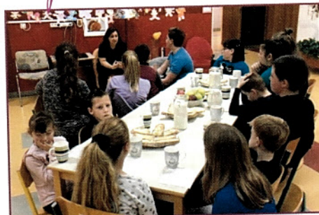
Skupni tradicionalni slovenski zajtrk.