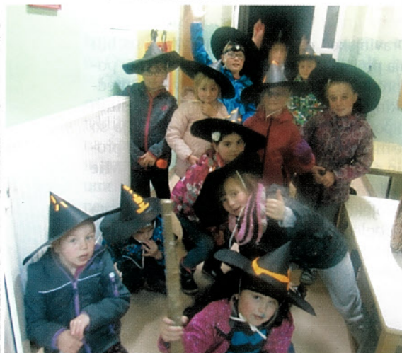
Čarovniki in čarownice po plesu s svetilkami.