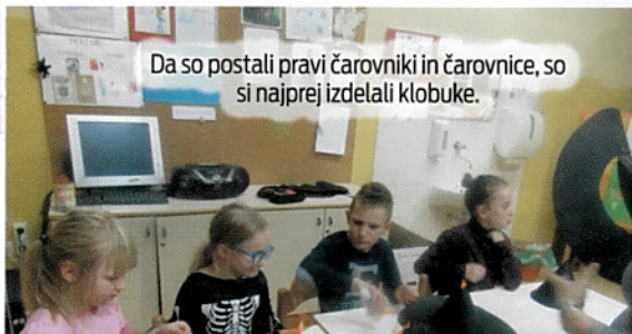
Da so postali pravi čarovniki in čarownice, so si najprej izdelali klobuke.