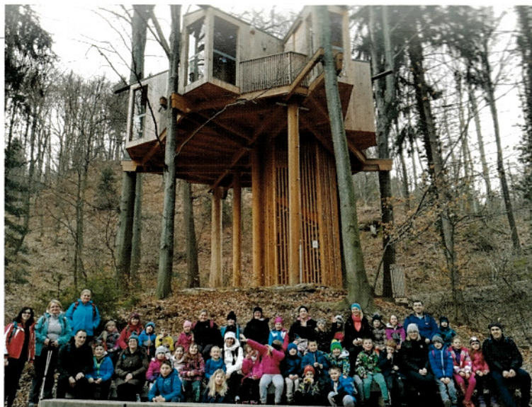
Bili so na pomladanskem pohodu v okolici Celja.