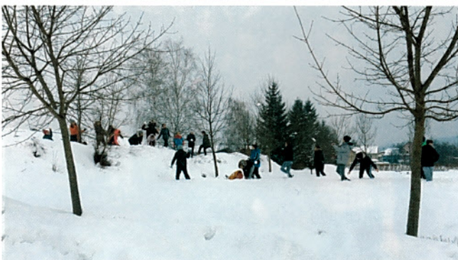
Poleg različnih duhovnih tem so se veroučenci družili ob različnih športnih aktivnostih.