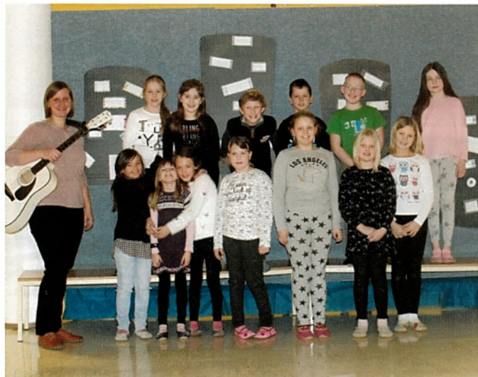
Pred tekmovanjem so učenci konjiške OŠ Pod goro tekmovalce pozdravili s kulturnim programom.