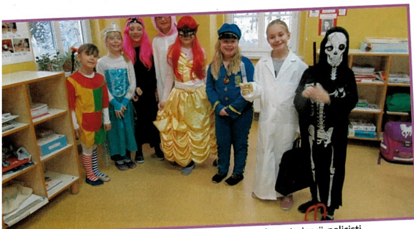
Na pustni torek pri pouku ni bilo učencev, prišle pa so princeske, veterinarji, policisti ...