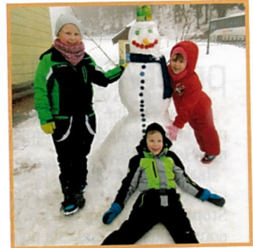
Likovna umetnost na snegu – sneg je pravi material za kiparjenje. Spretno roke so oblikovale pokončnega moža, ki je kar nekaj časa ponosno stal pred šolo.