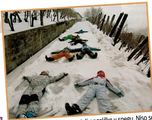
'Špitalski angelčki' so ustvarjali angelčke v snegu. Niso se mogli odločiti, kateri angelček je bil najlepši.

Zima, zima bela, v Špitaliču dolgo je 'čepela'. Snega ogromno je prinesla, otroke na bližnji hrib pogosto je ponesla!