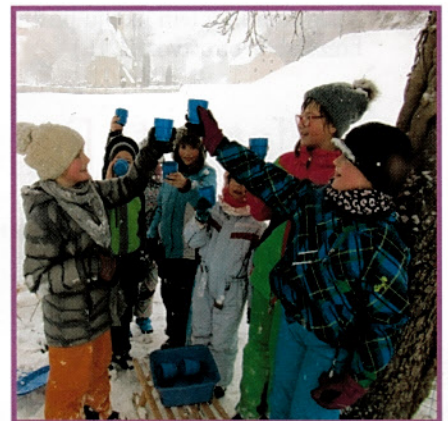
Imajo srečo, da šola stoji v osrčju narave: hrib za sankanje je v neposredni bližini in tako so se lahko kar med zimskimi norčijami ogreli s toplim čajem, ki jim ga je pripravila kuharica.