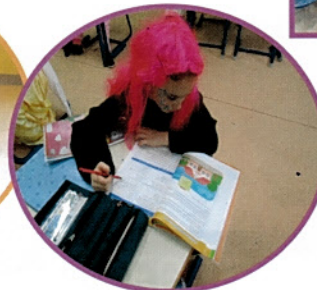
Tokrat so se s šolskim delom spopadle maškarke – dobro jim je šlo od rok.