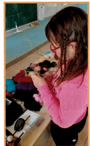
V šoli tudi veliko ustvarjajo. Po hodnikih so si pričarali pomlad z vrbovimi vejami – pisane veje pa so že skoraj priklicale pravcato pomlad, ki jih kar vabi v naravo in v raziskovanje prelepe doline in njene okolice.