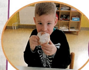
Pust je masten okrog ust – krofi so bili res odlični.