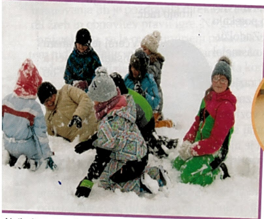
Najbolj so učenci veseli, ko jim uspe ujeti učiteljico in jo lahko nakepajo.