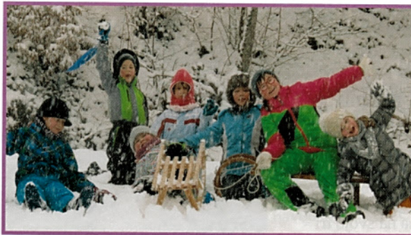
Poglejte, kako so nasmejani. To je dokaz, da res uživajo v naravi, ne glede na vreme.

Letošnja zima je poskrbela, da so se učenci OŠ Špitalič res naužili zimskih radosti, ki jih ni bilo malo. Pravijo, da pust odganja zimo: k pouku so na pustni torek prišle pustne šeme, da bi odgnale zimo – ni jim uspelo. Sedaj pa že vsi komaj čakajo, da sneg povsem skopni ter da na plan pokuka čim več znanilcev pomladi in bodo lahko raziskovali okolico še v spomladanskih mesecih.