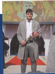
Urh Iršič, avtor Minattijeve pesni 2024.